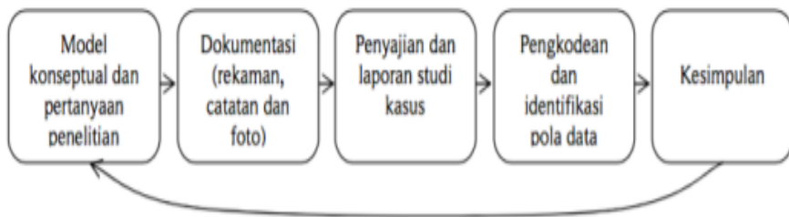
Gambar 3.2 Desain Penelitian Studi Kasus

Dalam penelitian studi kasus ini meneliti tentang fungsi komite sekolah dalam meningkatkan fasilitas sekolah di SD Negeri Kertajaya 03 dan SD Negeri Kertajaya 04 Kecamatan Gandrungmangu Kabupaten Cilacap.