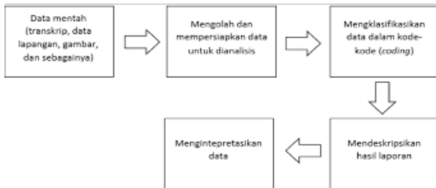
Gambar 3.2 Desain Penelitian Studi Kasus

Berikut desain penelitian kualitatif studi kasus dapat digambarkan sebagai berikut: